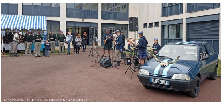
60e promotion - 20/11/2021 - Animation buffet par le groupe DOLO

L'émotion est aujourd'hui la même. La « Prière » nous prend aux tripes. Les souvenirs défilent et tissent ce lien entre nos promotions. Des EOA différents mais pourtant semblables à leurs aînés sont là, devant nous. Leurs regards clairs, malgré la nuit et une météo vivifiante, reflètent la joie et l'ambition qui les portent, comme elles nous portaient hier... Que c'était bon à voir, à vivre !